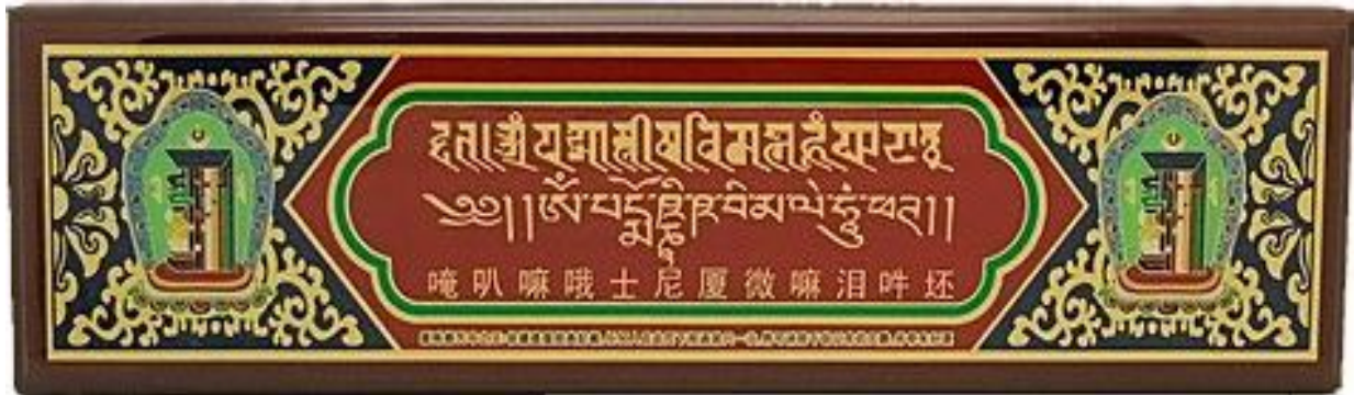
( Hình trên được lấy từ website:

http://infinityfengshui.com/index.php?main_page=product_info&cPath=3&products_id=1967 )