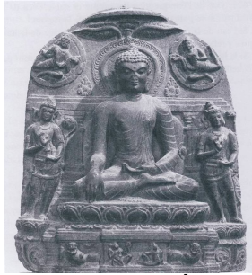
Đức Phật chạm tay xuống mặt đất để chứng minh cho sự chiến thắng của mình trước bọn ma vương (điêu khắc nổi thuộc triều đại Pala-sena, Ấn Độ, thế kỷ thứ X, đá Basalt màu đen, bảo tàng viện Guimet-Paris)

Thế nhưng lại chính là nhờ vào sự khám phá ra cái thể dạng vượt thoát khỏi mọi bám víu và hận thù luôn lôi kéo tất cả chúng ta phạm vào lầm lẫn, mà Đức Phật đã trở thành một sinh linh thiêng liêng. Cuộc đời và những lời giáo huấn của Ngài là những gì vô cùng kỳ diệu tượng trưng cho một bầu không gian mở rộng, vượt lên tất cả các quan niệm của đời thường. Đối với nhiều học phái thì Đức Phật không phải là một con người được sinh ra, sống và chết đi, mà thực sự chính là một thể dạng sinh linh luôn hiện hữu trong thực tại và đồng thời cũng là sự thật của chính cái thực tại ấy.